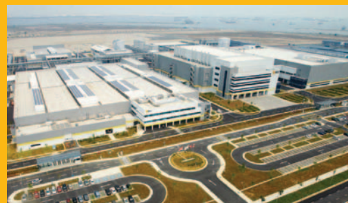
Plantas de producción en EE. UU y Singapur (foto).

REC es una empresa verticalmente integrada y líder en el sector de la energía solar. REC produce polisilicio, obleas, células y módulos para la industria fotovoltaica y otros materiales de silicio para la industria electrónica. REC participa también en el desarrollo de proyectos en segmentos específicos del sector fotovoltaico. Fundada en Noruega en 1996, REC emplea alrededor de 3500 personas en todo el mundo, con ingresos de más de 13.000 millones de coronas noruegas en 2011, aproximadamente 1700 millones de euros y 2400 millones de dólares. Visite www.recgroup.com para obtener más información acerca de REC.